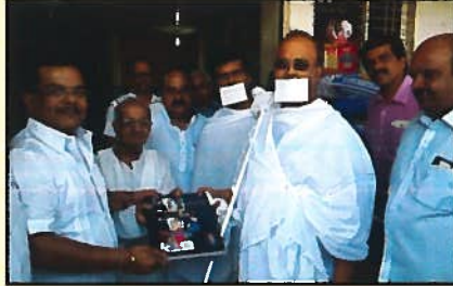
संचेती ट्रस्ट, पुणे - पुस्तक प्रकाशन