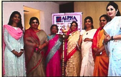
अल्फा डायग्रोस्टिक्स, पुणे - मेमोग्राफी शिबीर