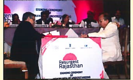
रामगढ मिनरल्स व राजस्थान सरकार - MOU