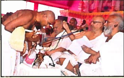
श्री. खरतरगच्छ महासंमेलन - पालिताना तीर्थ

“जितो कनेक्ट २०१६-पुणे” आंतरराष्ट्रीय संमेलन व परिषदेचे आयोजन दि. ८, ९ व १० एप्रिल २०१६ - धर्म, कर्म आणि ज्ञानाचा त्रिवेणी संगम * व्यापार वृद्धीची सुवर्ण संधी सर्वांना आग्रहाचे आमंत्रण - जितो पुणे