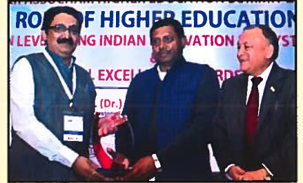
सुर्यदत्ता इन्स्टिट्यूट, पुणे - पुरस्कार