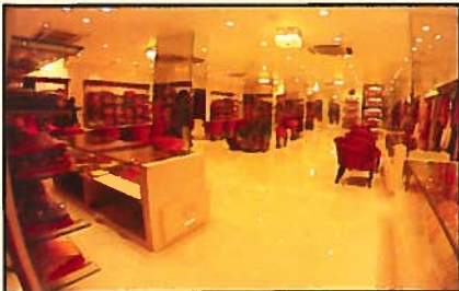
भारत वुलन हाऊस "Mohey" - उद्घाटन